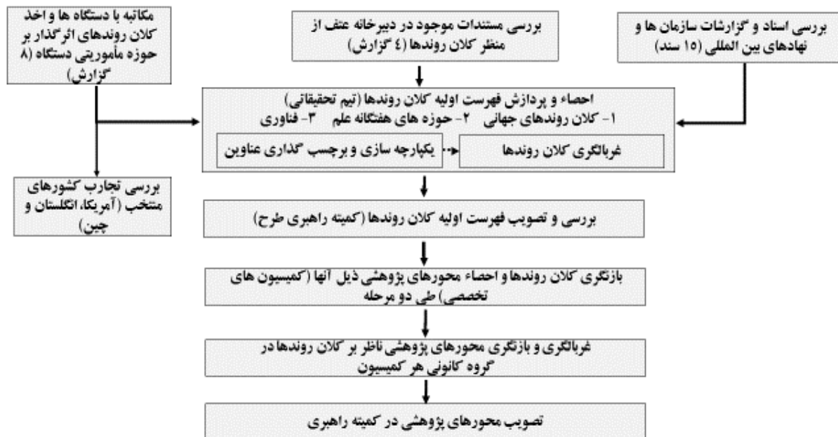
شکل ۱-۵ فرایند احصاء و دسته‌بندی کلان‌روندها و محورهای پژوهشی

جدول ۱-۲ تعداد کلان‌روندها و محورهای پژوهش علم و فناوری کمیسیون‌های تخصصی