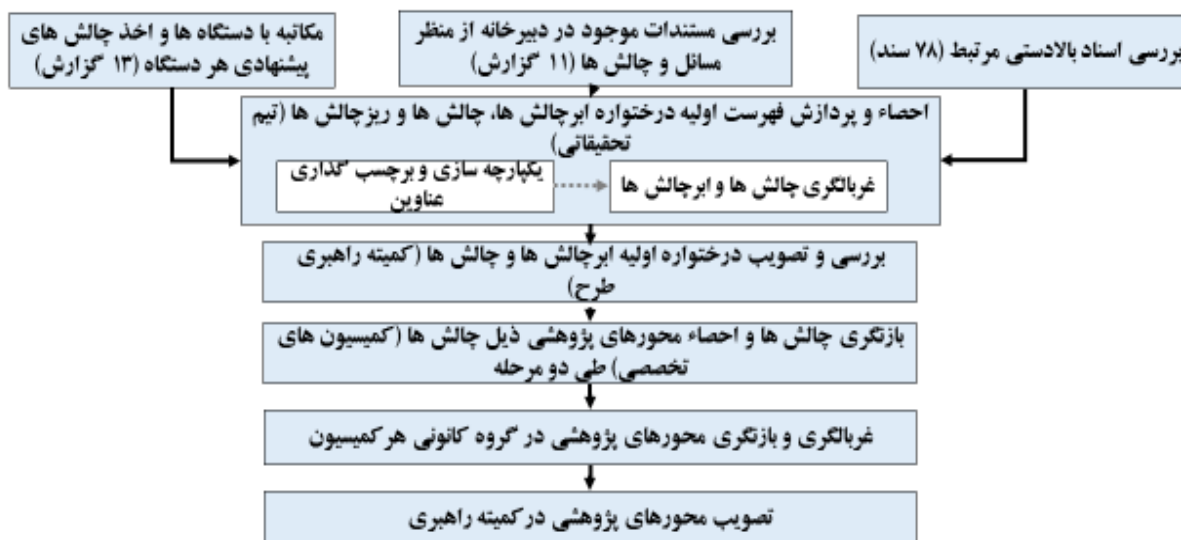
شکل ۴-۱ فرایند احصاء و دسته‌بندی ابرچالش‌ها، چالش‌ها و محورهای پژوهشی.

در این مرحله فهرست ابرچالش‌ها، چالش‌ها، کلان‌روندها و محورهای پژوهشی ذیل آنها (حاصل کار خبرگان) در کمیته راهبری بررسی شد. فرایند احصاء و دسته‌بندی ابرچالش‌ها، چالش‌ها و محورهای پژوهشی مرتبط در شکل ۴-۱ ارائه شده است.